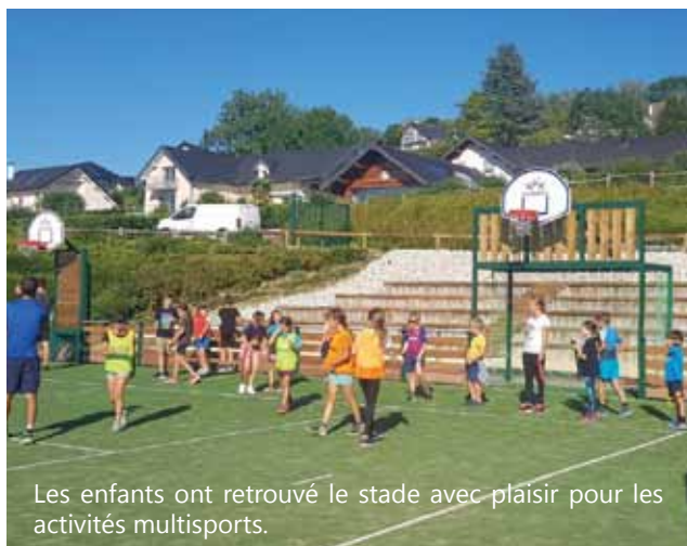
Les enfants ont retrouvé le stade avec plaisir pour les activités multisports.