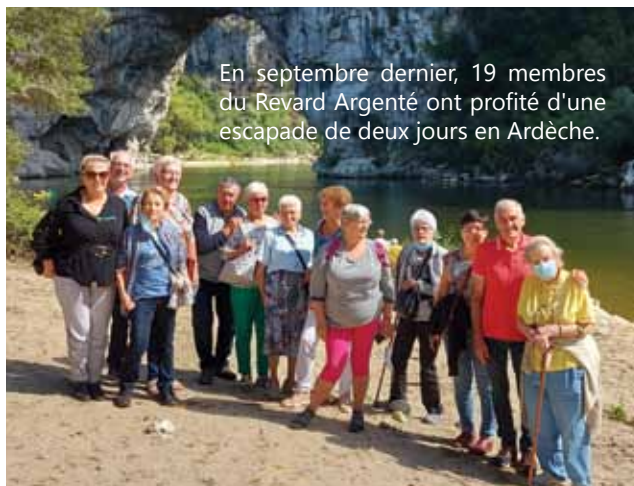
En septembre dernier, 19 membres du Revard Argenté ont profité d'une escapade de deux jours en Ardèche.

L'année se terminera par le repas de Noël, le dimanche 5 décembre.