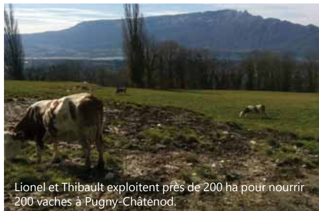
Lionel et Thibault exploitent près de 200 ha pour nourrir 200 vaches à Pugny-Châtenod.

Sur Pugny-Châtenod, une exploitation résiste. Le GAEC de l'Espérance, dirigé par Lionel et Thibault depuis 2012, exploite près de 200 ha pour nourrir ses 200 vaches (dont 100 vaches laitières). Acteurs d'une agriculture responsable, ils se sont engagés