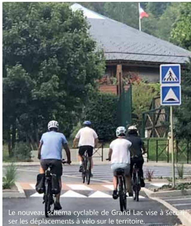
Le nouveau schéma cyclable de Grand Lac vise à sécuriser les déplacements à vélo sur le territoire.

Liste des vélocistes partenaires : grand-lac.fr/wp-content/uploads/2020/05/liste_velocistes_locaux-4.pdf