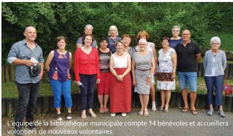
L'équipe de la bibliothèque municipale compte 14 bénévoles et accueillera volontiers de nouveaux volontaires.