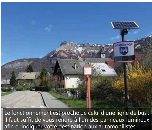
Le fonctionnement est proche de celui d'une ligne de bus : il faut suffire de vous rendre à l'un des panneaux lumineux afin d'indiquer votre destination aux automobilistes.