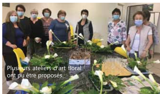
Plusieurs ateliers d'art floral ont pu être proposés.

L'art floral a pu proposer quelques ateliers (Noël, Pâques et fête des mères), en respectant les règles sanitaires. Chacune était ravie de retrouver les amies, les fleurs et le moment de convivialité après ce confinement.