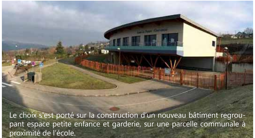
Le choix s'est porté sur la construction d'un nouveau bâtiment regroupant espace petite enfance et garderie, sur une parcelle communale à proximité de l'école.

Face aux besoins croissants en matière de garde d'enfants, la municipalité a opté pour la construction d'un espace petite enfance et garderie, à proximité de l'école, ce qui présente de multiples avantages. Le bâtiment devrait être livré au printemps 2023.